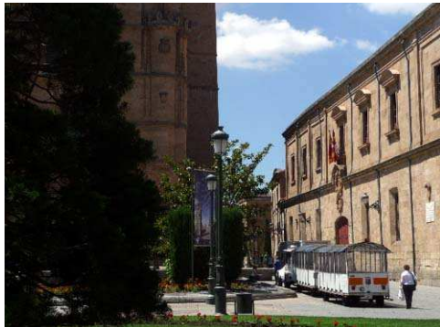
Photo 5 - Salamanque, entre la cathédrale et l'université - © R. Knafou, juin 2009.

Ces deux villes de grand prestige partagent beaucoup de points communs : outre l'existence d'un remarquable patrimoine qui justifie leur présence dans cette note, elles présentent une combinaison originale dont les éléments sont l'université, l'église et le tourisme, et leur centre-ville est à l'évidence touristifié, comme le confirme notamment dans les deux lieux la présence du désormais inévitable petit train touristique (photo 5 et photo 6). En fait, elles relèvent d'un sous-type bien représenté en Europe, celle de la ville universitaire ancienne touristifiée, catégorie dans laquelle on peut ranger Cambridge, Oxford, Coïmbra, Heidelberg, Lund ou Padoue, et qui a été exportée (par exemple New Haven, aux Etats-Unis, qui est construite autour de l'université de Yale). Seule la France échappe complètement à ce type de ville, pour des raisons historiques propres à cet espace, l'université la plus ancienne et la plus prestigieuse - La Sorbonne - ayant été implantée dans la capitale politique.