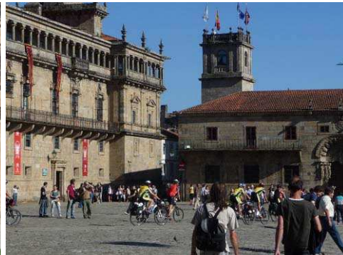
Photo 6 - Saint-Jacques de Compostelle, place de l'Obradoiro, où affluent pèlerins et touristes - © R. Knafou, juin 2009.

Tout en relevant de la catégorie des villes universitaires anciennes touristifiées, Saint-Jacques de Compostelle offre un cas plus complexe de lieu où pèlerinage et tourisme se mêlent étroitement. Si on peut considérer que le pèlerinage - voyage effectué par un croyant vers un lieu de dévotion, tenu pour sacré dans sa religion - est un déplacement historiquement et symboliquement très différent du tourisme, le cas de Saint-Jacques est là pour brouiller les pistes 2 .