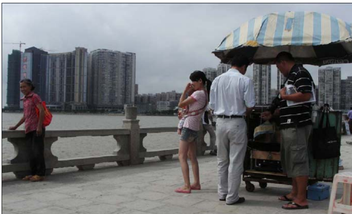
Photo 3 - Négociation du prix d'une photo. En arrière-plan, la région administrative de Macao. Les Chinois accèdent depuis peu au tourisme mais tous ne peuvent pas se payer un séjour touristique. Une bonne photo s'avère primordiale pour prouver aux autres (amis, collègues et famille) que l'on s'est rendu dans un lieu touristique connu. De nombreux stands de prise en photo, avec développement immédiat, assorti de la date et du lieu, fleurissent dans tous les sites touristiques. Ici c'est la frontière, l'ouverture sur le monde qui est recherchée avec la région administrative spéciale de Macao en arrière-plan. Sur cette photo on voit notamment un jeune couple avec enfant, le mari choisissant le type de prise de vue et négociant le prix (10 yuans), son épouse portant leur enfant. A gauche, une femme plus âgée appartenant à un groupe organisé prend la pose.

pour les résidents chinois du continent (photo 2). Preuve que ce port est un important point de commerce, sous la vaste esplanade, devant le hall, se trouve un immense centre commercial dont les horaires d'ouverture se calent sur ceux du port.