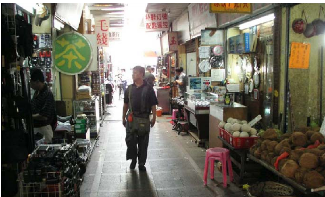
Photo 8 - Le marché couvert à côté de la gare routière de Gongbei

mètre carré le long de la mer, un bon repas constitué de fruits de mer semble plus important que la découverte de l'environnement de ces délices.