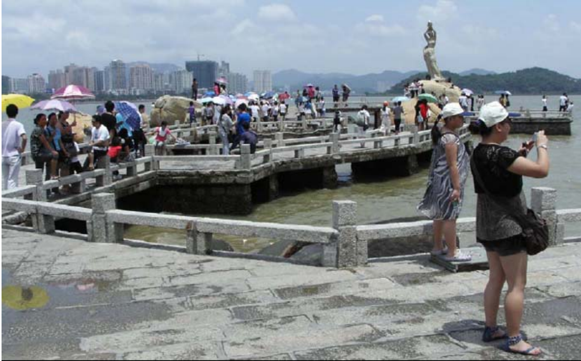
Photo 5 - Touristes chinois devant la Sirène de Zhuhai

Nombreux sont les touristes et les visiteurs qui se rendent dans ce site, éloigné d'au moins un kilomètre des habitations. Le quartier au nord est visible en arrière-plan à gauche de la photo. L'accessibilité est assurée par de nombreuses lignes de bus ainsi que quelques places de parking pour des voitures individuelles. La sirène est l'attraction principale et peu de touristes prennent le temps d'observer la mer où les petites collines et rochers qui s'y trouvent (comme en arrière-plan, à droite de la photo). Les touristes accordent plus d'importance au fait de se faire prendre en photo devant la statue et à passer un bon moment dans un lieu très fréquenté, donc animé, « renao » en Chinois (soit « bruyant et animé », ce qui « détend l'esprit »).