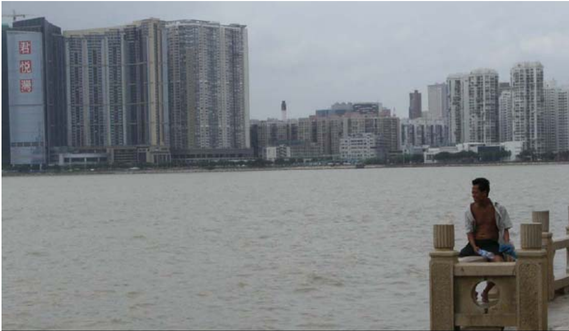
Photo 4 - Travailleur migrant face à Macao

L'arrière-plan de cette photo est à peu près similaire au cliché précédent, on reconnaît les immeubles du nord de Macao. Seuls les protagonistes ont changé, ici c'est un travailleur migrant qui est au premier plan, de trois-quarts devant la région administrative spéciale. Beaucoup de migrants espèrent comme lui accéder à une vie meilleure en venant s'installer en ville, mais beaucoup sont déçus. En effet, le système du Hukou, limitant considérablement l'accès aux soins, à l'éducation et au logement pour ceux qui sont nés à la campagne et imposant un livret les « assignant » quasiment à résidence. Ceux qui tentent leur chance ont des réussites variées, notamment en fonction de la destination choisie : les villes petites et moyennes sont plus enclines à les intégrer (pour peu qu'ils aient un peu d'argent) à la vie de la cité. L'arrivée de populations nouvelles y est considérée comme positive car source de dynamisme. Le migrant de la photo n'a pas eu cette chance et collecte aujourd'hui les bouteilles en plastique vides afin de les revendre et ainsi de gagner quelques centimes.