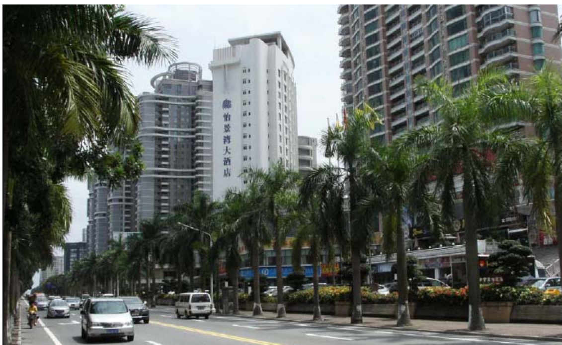
Photo 1 - Arrivée à Gongbei, le quartier le plus au sud de Zhuhai

Après une courte nuit, ma journée commence à 5h. Comptant économiser, je me rends à la station de métro à la porte ouest de l'Université, mais là, petite erreur, si le métro ouvre bien à 5h30, il me faut attendre la première rame qui, venant du sud de la ville, ne passera pas avant une heure. Mon bus est à 6h40, je n'ai donc pas le choix, je prends un taxi. Premier bilan, au lieu de payer deux yuans pour le métro, je débourse 16 yuans : mon budget commence à fondre. Mieux vaut prévoir large lorsqu'on souhaite prendre quelques loisirs, même le temps d'une journée. Autant dire que celui qui part pour un séjour touristique de plusieurs jours doit constituer un budget important. On s'évade souvent en famille (parents et enfant unique) et il faut alors compter pour trois, ce qui explique que beaucoup de touristes s'en remettent encore aujourd'hui aux prestations des voyagistes, qui eux proposent des prix négociés. Seul 15% de la population a accès au tourisme en Chine.