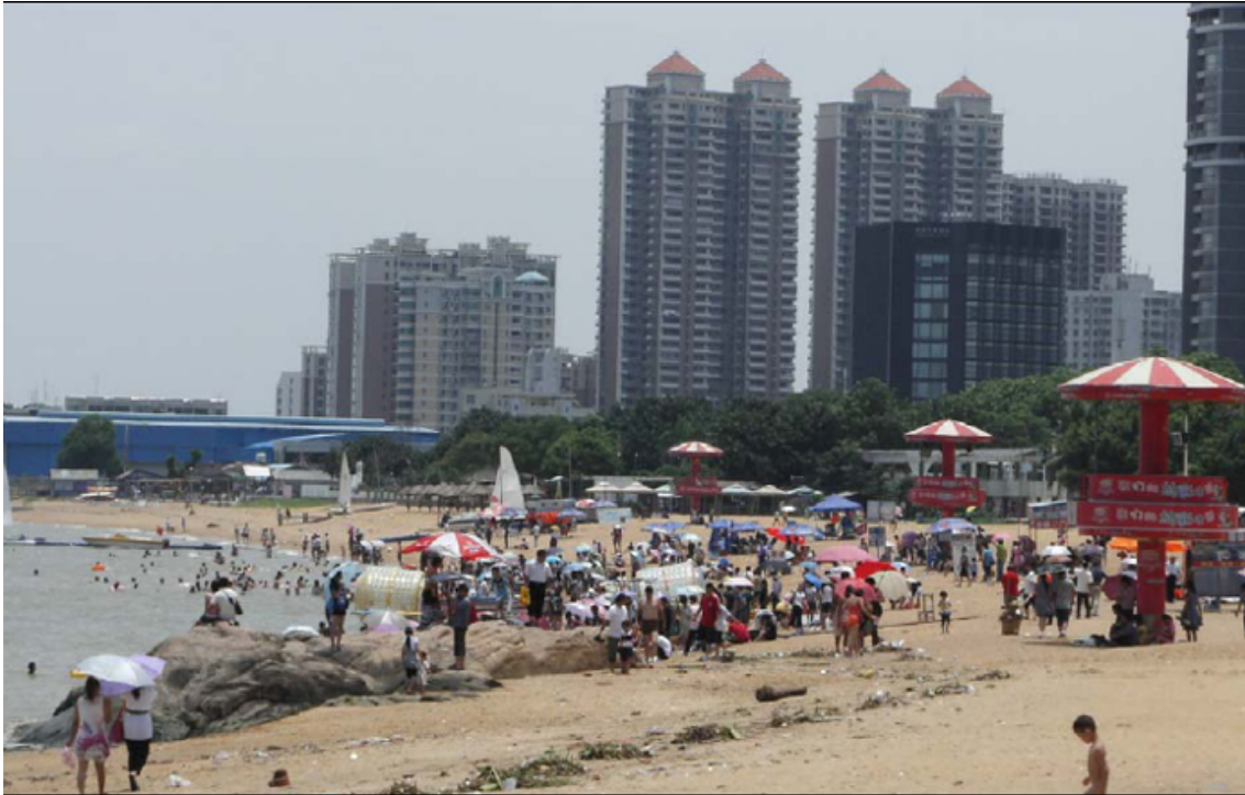
Photo 6 - La plage des amoureux

Nous sommes ici clairement en présence d'une plage urbaine, insérée dans un tissu urbain dense comme le montre les immeubles en arrière-plan, des tours d'habitations mais aussi des hôtels, à la manière de la photo 1. Le deuxième point intéressant concernant cette plage est que la plus importante de la ville de Zhuhai et surtout la seule qui soit vraiment aménagée au goût des Chinois (postes de secours, restaurants sur la plage, jet-ski, voiliers, etc.). En rapport à la taille de la ville et de son littoral on constate donc que les locaux ne se baignent que peu et que les visiteurs de passage sont eux aussi peu enclins à profiter des joies du bain. On vient davantage pour profiter du bon air et du bord de mer (cf. les descriptions du guide touristique imprimé) que de la baignade.