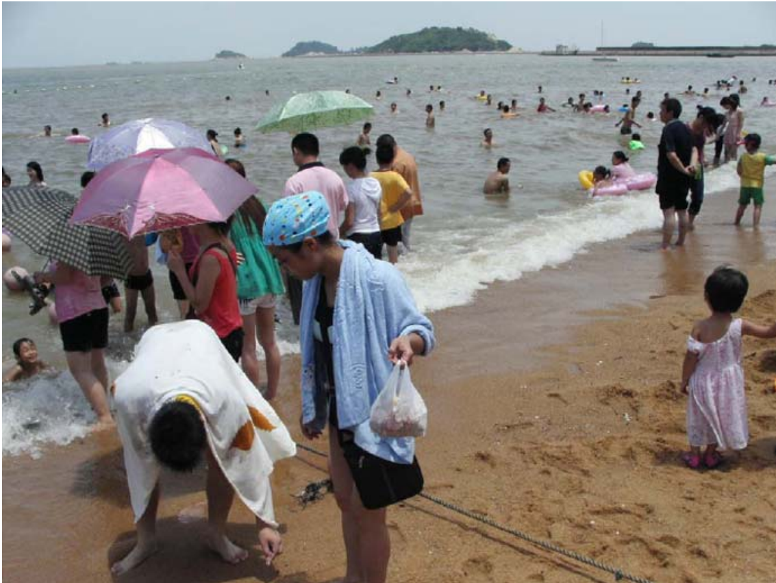
Photo 7 - Scène de la plage des amoureux en début d'après-midi

Cette photo nous présente une division entre les touristes qui observent la mer et ceux qui s'y trempent. Même si cette photo ne le montre pas, les premiers sont plus nombreux que les seconds et au sein de ceux-ci, il y a différentes attitudes : certains (la majorité) se protègent du soleil avec des ombrelles (des parapluies auxquels on a trouvé une nouvelle fonction) alors que d'autres semblent ne pas craindre les morsures du soleil. Ceux qui se baignent ne savent en majorité pas nager et restent donc là où la profondeur de l'eau leur permet de marcher tranquillement. A ces deux catégories il faudrait ajouter ceux qui sont en maillot mais ne se baignent pas forcément ou très peu (comme les deux jeunes au premier plan, devant les ombrelles).